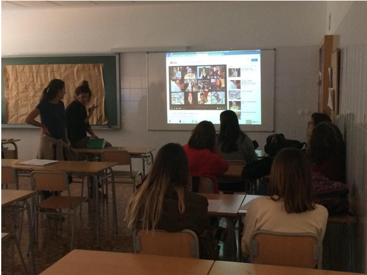
Sessió 3 a l'IES La Foia de Bunyol.