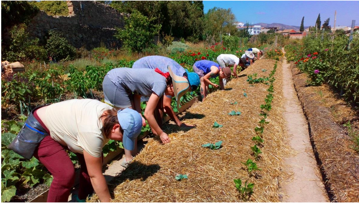
Huerta jardín del boticario.

* Per aprofundir en cadascuna de les persones i el seu coneixement s'ha de consultar la pàgina web: