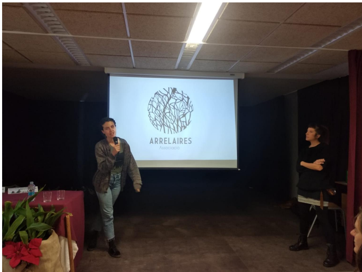
Presentació de l'associació a les jornades forestals de l'IES Foia de Bunyol

Com a activitat complementària hem participat en les jornades forestals de l'IES Foia de Bunyol, amb el títol "Emprenedoria i ocupabilitat en el medi rural" on hem compartit el nostre projecte al costat d'altres iniciatives diverses del territori.