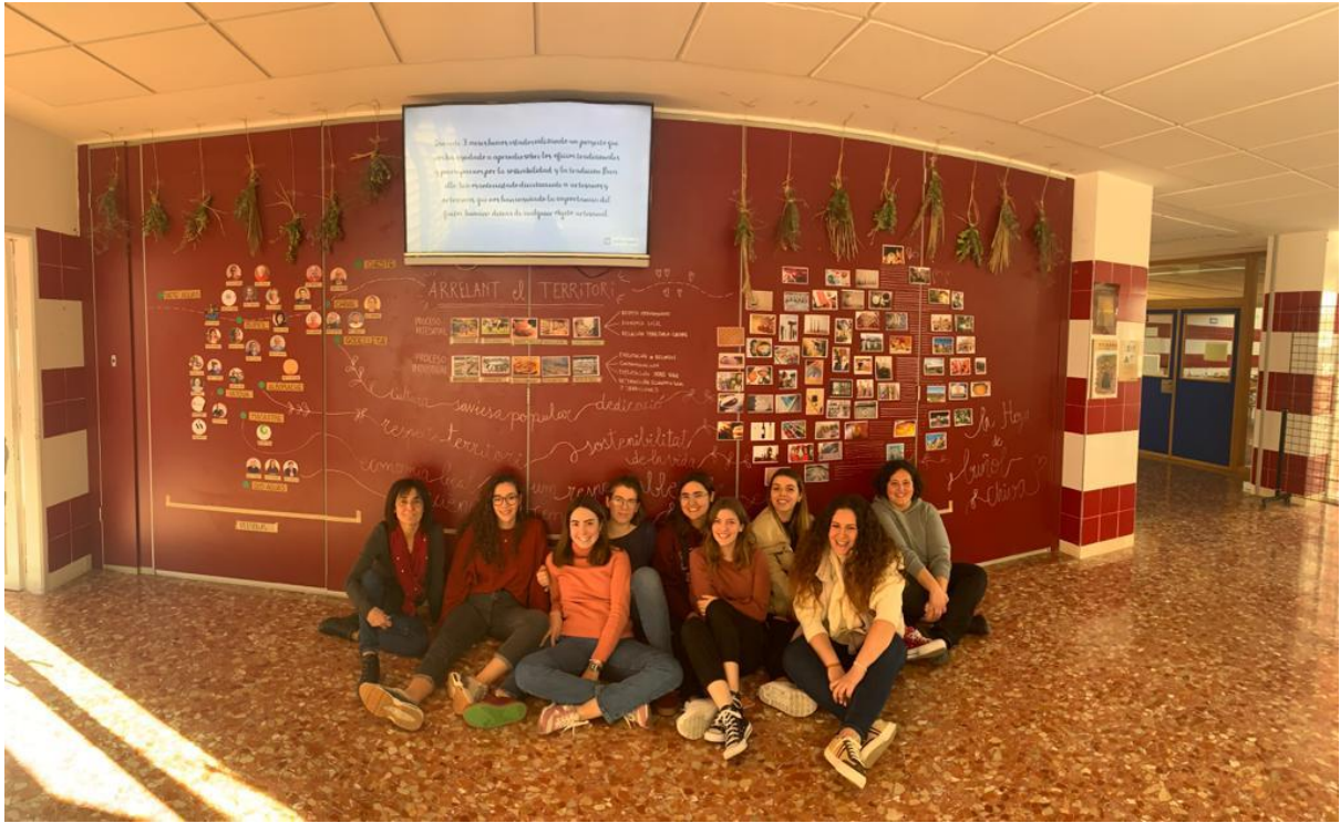
Foto de l'exposició del treball realitzat a l'IES La Foia de Bunyol.