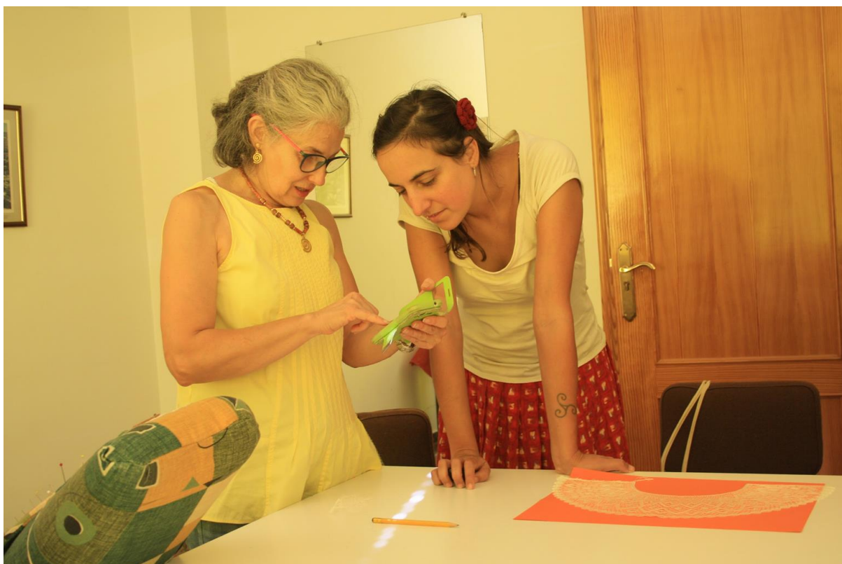
Entrevista al grup de boixet en la casa de la cultura, Alboraiç.