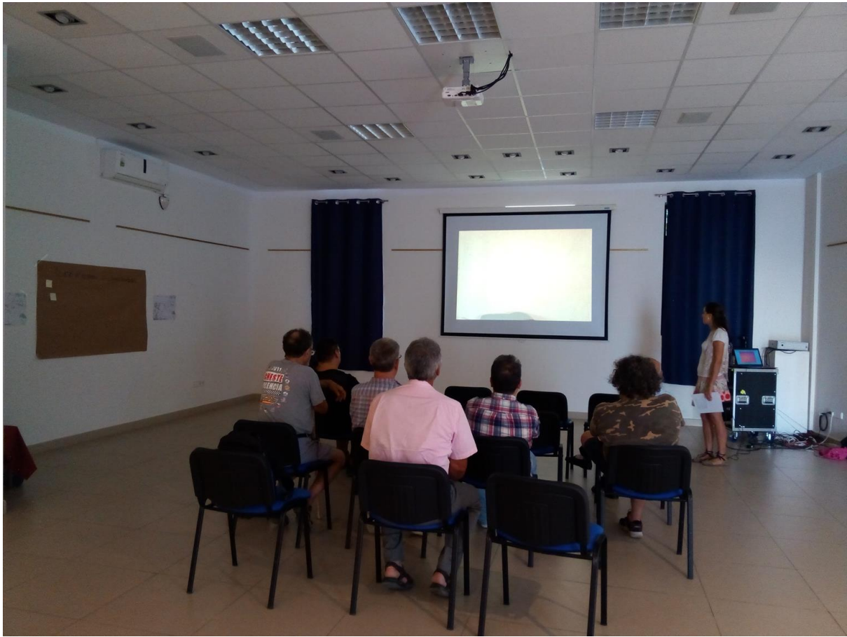
Reunió amb persones referents del territori.