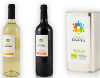
Productes Campus Diversia.

Com a iniciatives de dinamització del coneixement tradicional i de l'ús dels recursos naturals hem trobat dues iniciatives: "Campus Diversia" i "la Huerta-jardín del Boticario". Aquestes iniciatives estan relacionades amb l'agricultura principalment, la gestió dels cultius, i amb la producció de productes locals ecològics, però que a més d'això fan formació i en el cas del Campus Diversia és un projecte d'innovació social.